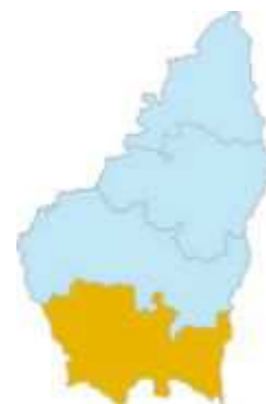
Ardèche Plein sud

Entre ombre et lumière. Site classé - Rivière souterraine fossilisée.