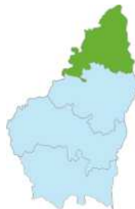
Ardèche vert (Nord)

Un moment de vie inoubliable ! Embarquez à bord de nos nacelles, survolez