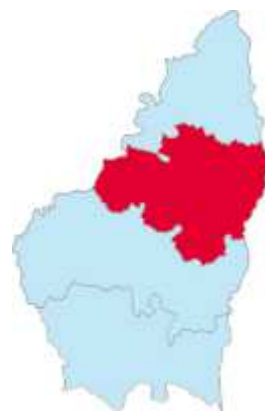
Ardèche plein Cœur

Un site occupé par l'Homme depuis plus de 15 000 ans.