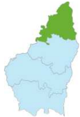
Ardèche vert (Nord)

Scène après scène, découvrez et partagez la vie des bouilleurs de cru et distillateurs ambulants.