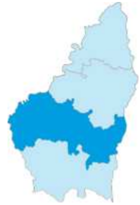
Sources et volcans d'Ardèche

Venez revivre en famille les temps forts d'antan !